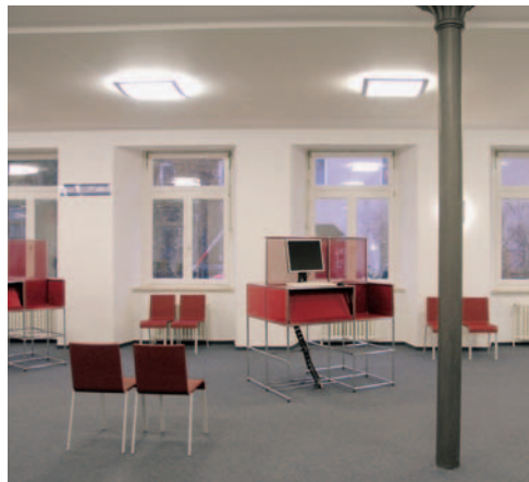
„Die absolute Stärke von USM-Haller ist seine Variabilität.“

„Wegen seiner modularen Bauweise kann das in diesem Fall dunkelrot, kombiniert mit silber gestaltete System im Rahmen technischer Anforderungen oder auch innenarchitektonischer Änderungen jederzeit angepasst und erweitert werden.“