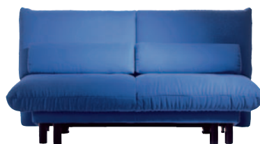
Schlafsofa Quint 950,-

Die Angebote sind bis zum 30. Juni 2005 gültig.