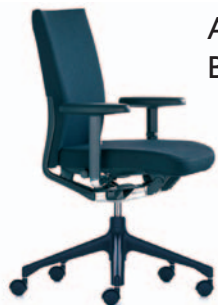
Arbeitsstuhl Black Axess