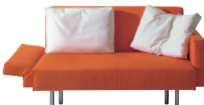
Schlafsofa Clai 1.295,-