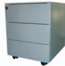
Metall-Rollcontainer Profi 229,-