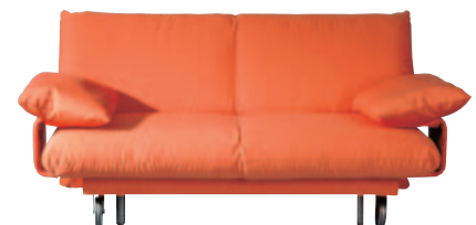
Schlafsofa Camp 1.390,-