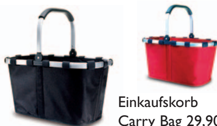
Einkaufskorb Carry Bag 29,90