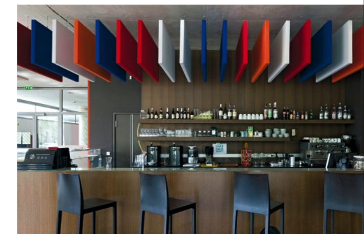
Stereo-Schirme an durchgehenden Seilen angehängt

Ihr Unternehmen vor Ort, erstellen eine Planung und entwickeln Ideen, um auch bei Ihnen eine behagliche und kommunikative Umgebung zu schaffen! Fordern Sie einfach Informations-Material an unter: info@helten.com