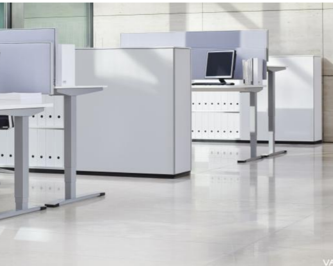
03 Beschreibung Beschreibung