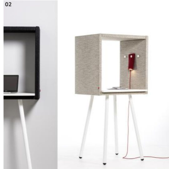
02 Beschreibung Beschreibung