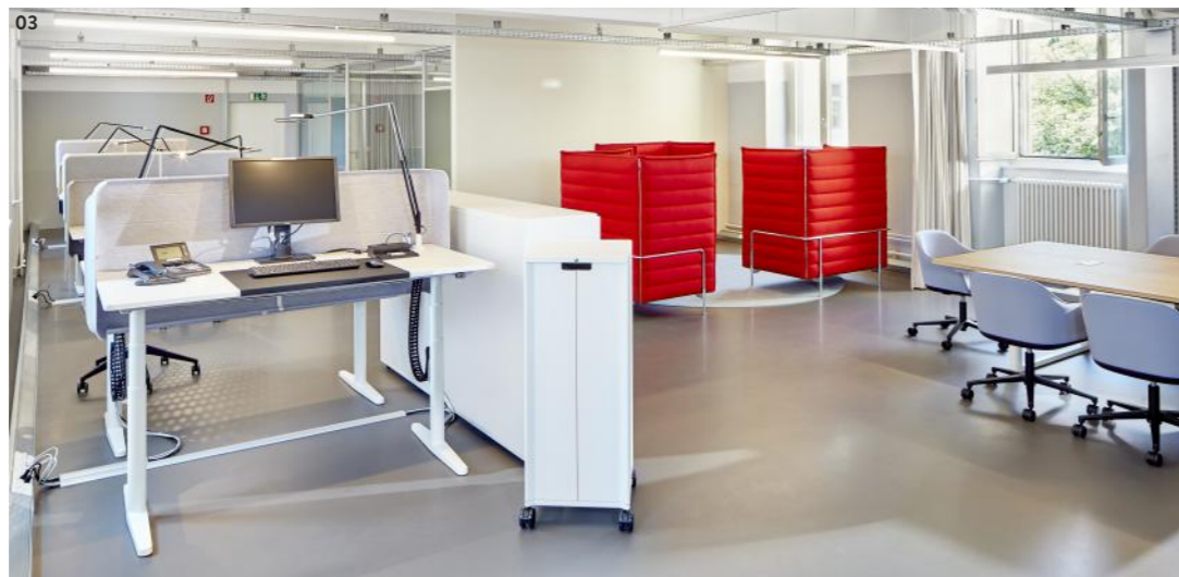
03 Beschreibung Beschreibung

währt haben sich Schreibtische mit Sitz- und Stehfunktion. Wer 1/3 seiner Arbeitszeit stehend verbringt und 2/3 sitzend, steigert nachweislich seine körperliche und geistige Leistungsfähigkeit am Arbeitsplatz. Bürodrehstühle mit individuellen Verstellfunktionen passen sich ideal dem Körper an, machen Bewegungen mit und beugen so Verspannungen und Rückenleiden vor.