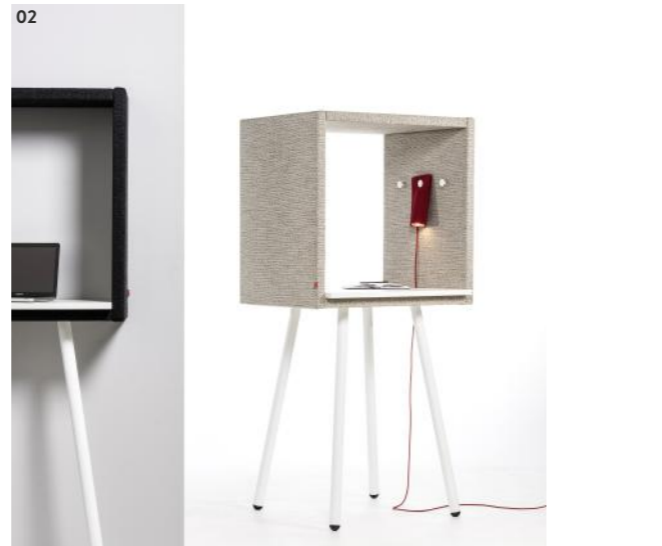
02 Beschreibung Beschreibung