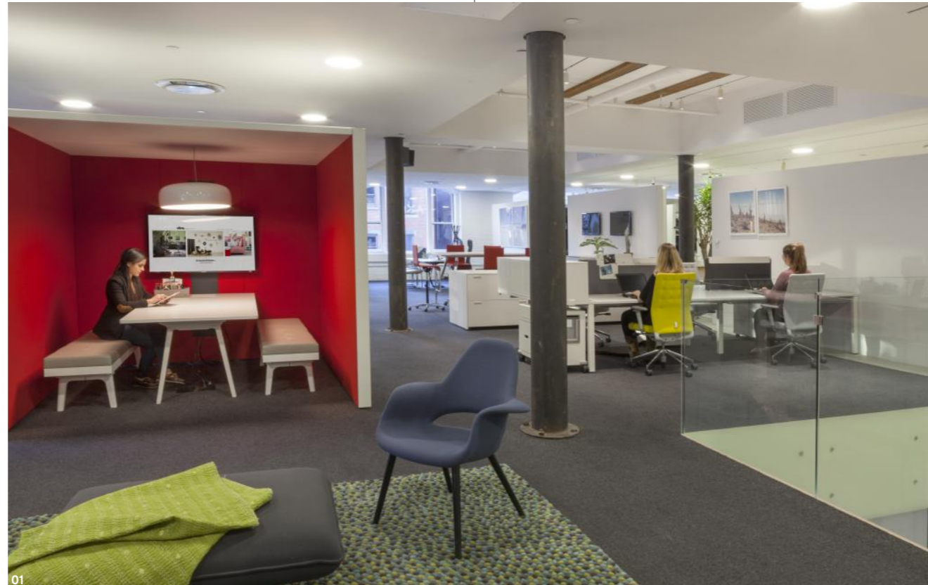
01 Beschreibung Beschreibung