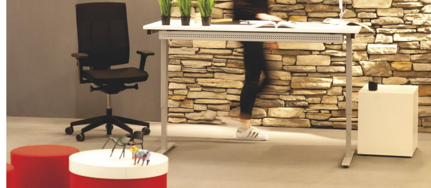
05 Beschreibung Beschreibung