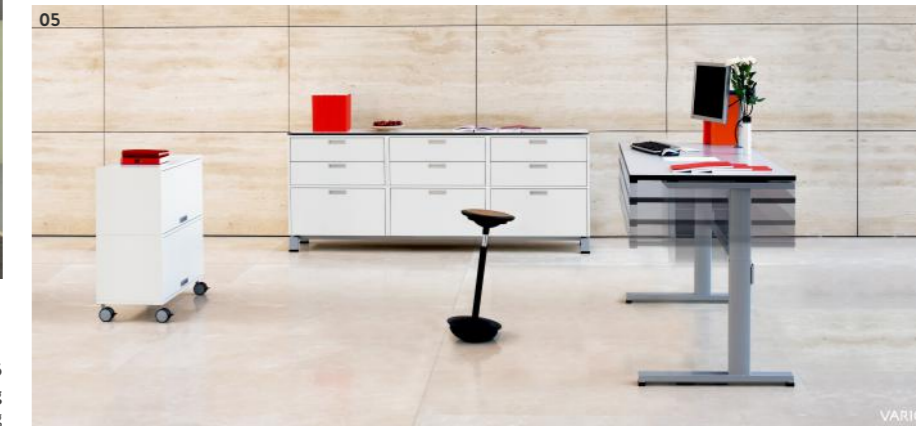
05 Beschreibung Beschreibung

dementsprechend sollte der Arbeitsplatz gestaltet sein. Die Innenarchitekten/innen bei Helten Einrichtungen in Göttingen stellen sich dieser Thematik und erarbeiten mit computergestützten Planungsprogrammen unterschiedliche Varianten für das jeweilige Projekt aus. Der Kunde gewinnt dank farbig angelegter Grundrisse, Ansichten und 3-D-Planungen eine gute räumliche Vorstellung – ein wichtiger Faktor für eine Entscheidungsfindung. So entstehen ergonomisch durchdachte Arbeitsräume mit Wohlfühlfaktor.