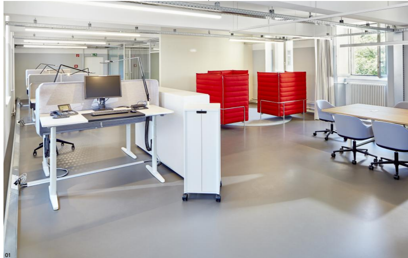
01 Beschreibung Beschreibung

Gerade an Bildschirmarbeitsplätzen besteht häufig Handlungsbedarf. Zwar gibt der Gesetzgeber Mindeststandards vor, doch letztlich ist der Mensch selbst dafür verantwortlich, den richtigen Abstand zum Bildschirm einzuhalten, eine dynamische Sitzhaltung einzunehmen oder den Arbeitsplatz richtig auszuleuchten. Eine professionelle Planung vom Fachmann kann die beste Unterstützung bieten, um am Arbeitsplatz gesund zu bleiben. In der Praxis be-